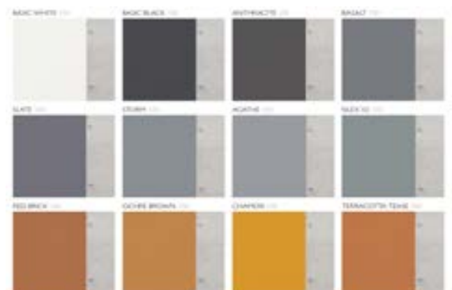
Exemples de couleurs. La teinte finale dépend de la teinte initiale du support.

Les lasures ProtectGuard® Color se déclinent en 42 coloris standards et sont disponibles en finition mate ou brillante. Il est également possible de réaliser des teintes à façon en laboratoire ou chantier sur demande.